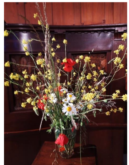
dit zomerse boeket gebruikte Annegreet bij haar dienst van 13 juni

zie verder bij 11 juli. Collecte: Vrienden van Naarderheem